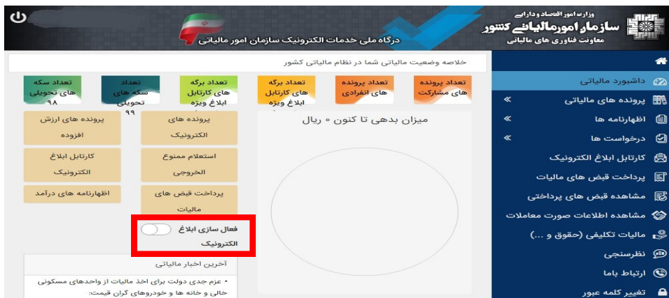
شکل شماره ۲